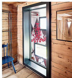
Aux Losanges. Raumansicht.