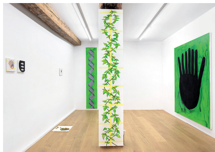
Christian Rothmaler · Mountain View on Neom Om 宇宙, 2018, Ausstellungsansicht Galerie Kirchgasse, Steckborn.

→ Galerie Kirchgasse, Steckborn, bis 17.11. ↗ www.kirchgasse.com